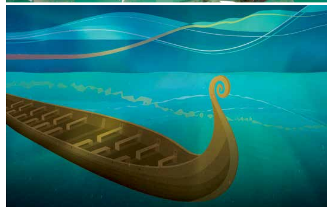
Visjoner med norrøn referanse På en valgkampturné i august 2021 tok Jonas Gahr Støre og Hadia Tajik turen til Equinor i Stavanger, der de markerte oppstarten av Equinors testanlegg for CCS og hydrogen på Forus. Langskip er prosjektnavnet for den storstilte satsingen på fullskala CO 2 -håndtering.

Strategien for prosjektet ble lagt frem i statsbudsjettet for 2015. Deretter fulgte en lang periode med utredninger, trolig fordi regjeringen var usikker på realismen i prosjektet og, ikke minst, statens kostnader.