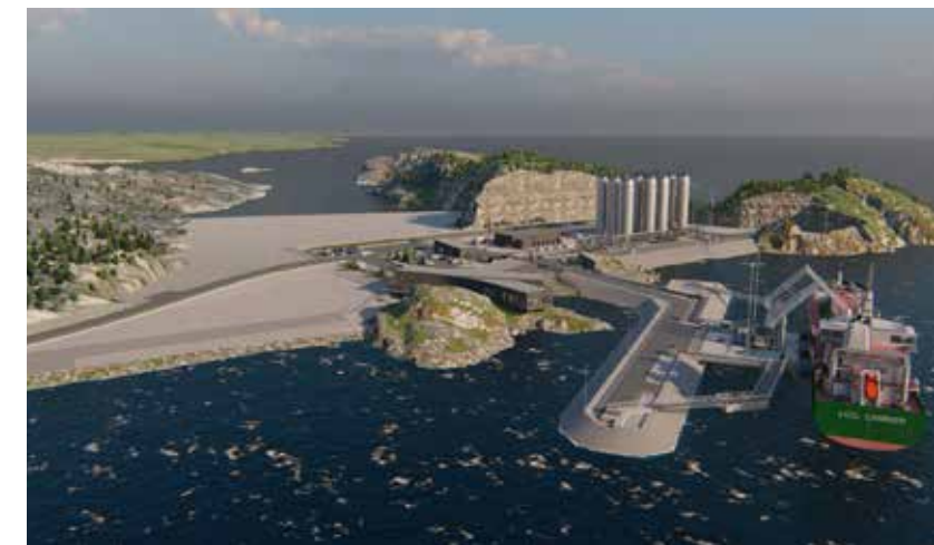
Mellomlager Northern Lights-prosjektets mottaksterminal, slik den er tenkt plassert i Øygarden. Herfra skal CO 2 -gassen pumpes gjennom rør ut på sokkelen.

Skiferlaget kan være flere hundre meter tykt, og risikoen for CO 2 -lekkasje skal være minimal. Etter lang tid blir gassen en del av sandsteinen. Denne formen for lagring er testet ut og overvåket på sokkelen siden 1996, da Statoil (nå Equinor) begynte med å fange og lagre CO 2 fra gassutvinnningen på Sleipnerfeltet for å gjøre den CO 2 -rike naturgassen salgbar.