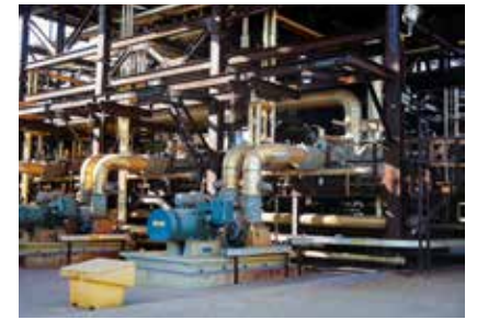
Bot og bedring på flere kontinenter I Canada har Shell anlagt et CCS-anlegg utenfor Alberta som skal lagre 880 000 tonn CO 2 årlig 2 km ned i bakken i salt-holdig akvifersedimenter.

En infrastruktur med kapasitet for mange prosjekter, vil kunne senke terskelen for å etablere nye fangstprosjekter. Men for å komme dit, må staten investere milliarder av kroner.